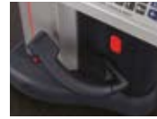
Com Manipulo 518-352A-21