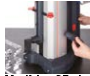
Medidor 2D de classe mundial