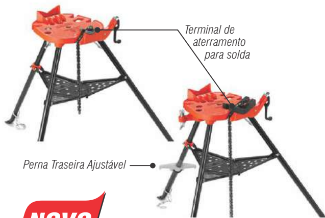
Terminal de aterramento para solda