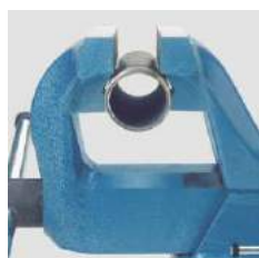
Os mordentes para tubos de grandes capacidades para prendê-los com segurança