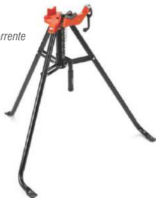
Torno de Corrente Portátil 425