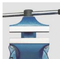
Os mordentes maiores permitem uma superfície de ajuste mais ampla.