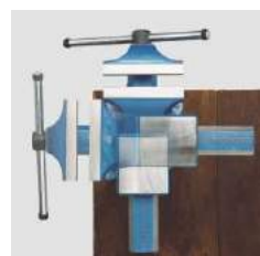
Base Giratória de Ajuste infinito, permite que o torno se feche com segurança em qualquer posição