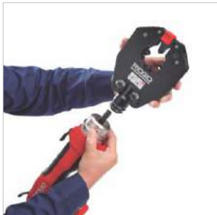
RIDGID® QuickChange System™ Sistema de Engate Rápido