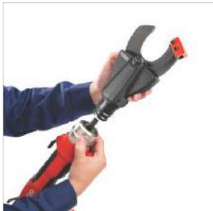
RIDGID® QuickChange System™ Sistema de Engate Rápido