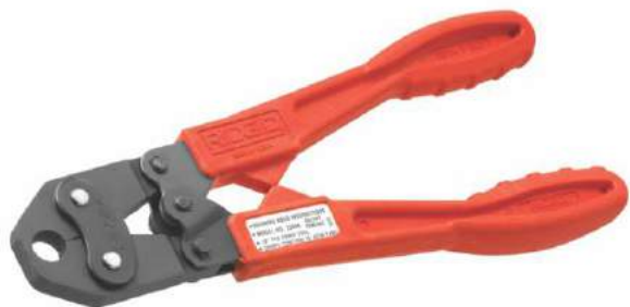
ASTM F 1807 PEX Crimp Tool