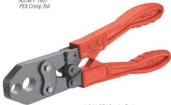
1/2 & 3/4 PEX Combo Tool