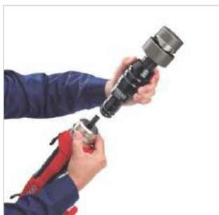
RIDGID® QuickChange System™ Sistema de Engate Rápido