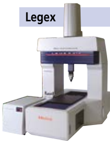
Mais Exata do Mundo