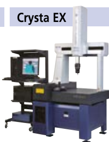
Medição com 5 eixos e redução de tempo