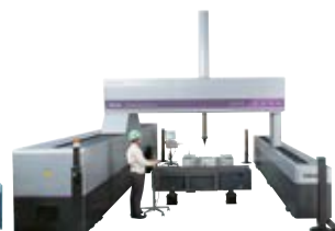
Peças de Grande Porte