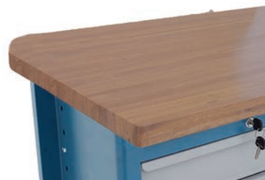
Tipo Angelim bicolado envernizado (45 mm)