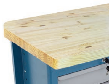
Pinus bicolado envernizado (45 mm)