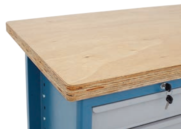
Compensado naval envernizado (45 mm)