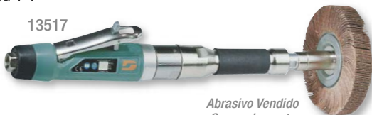
Abrasivo Vendido Separadamente