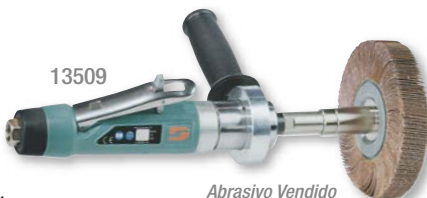
Abrasivo Vendido Separadamente