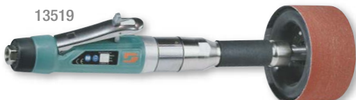
Abrasivo Vendido Separadamente