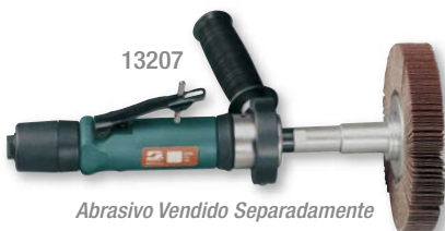
Abrasivo Vendido Separadamente