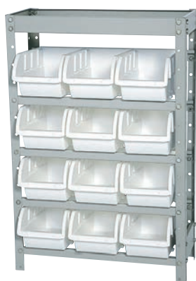
Características gerais › 12 caixas n° 5