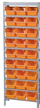
Características gerais › 27 caixas n° 5