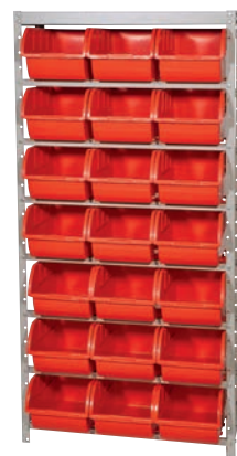
Características gerais › 21 caixas n° 7