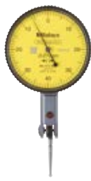
513-474E Ponta de Rubi