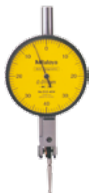
513-404E Ponta em Metal Duro