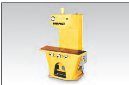
◀ Prensa de Oficina de 50-ton. para Trabalhos de Manutenção.