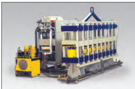
◀ Prensa de Alta Precisão de 1.800 tons. Totalmente Automatizada e Controlada por PLC.

nossa experiência mundial, oferecemos as melhores soluções, especialmente quando a segurança é um item imprescindível. Seja um curso longo, armações mais largas ou a necessidade de um novo projeto, nosso grupo de customização de produto tem muitos anos de experiência nas mais diversas indústrias para oferecer uma solução que vá de encontro ou exceda as expectativas.