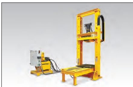
◀ Prensa de 100 ton. para Montagem de Cilindros com Mola para Carregamento